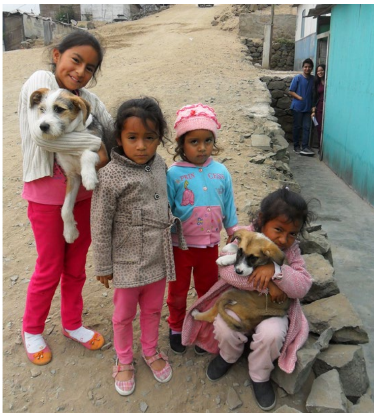
Relación niño-perro es muy estrecha.

Los funcionarios sugieren que para mejorar la aplicabilidad de la Ordenanzas se debe de superar los problemas mencionados en el párrafo anterior y además mencionan los siguientes: “Ampliar la descripción de poseedor de un can a aquel que contribuye con la alimentación y/o refugio de un animal por un periodo mayor a 30 días”, “Permitir la eutanasia inmediata de animales enfermos graves o agresivos que deambulan por la vía pública”, “Implementar sanciones administrativas a gobiernos locales que no cumplan con la normativa”, “Implementar o incluir los temas de tenencia responsable de animales de compañía en la currícula escolar”, “Permitir la realización de campañas de