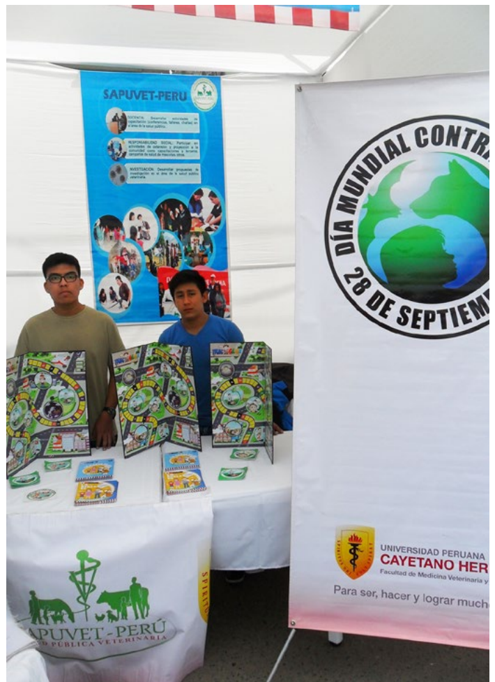
Importante difusión del Día Mundial de Lucha contra la Rabia 2017.

Se debe de tener en cuenta que el conocimiento de la población de canes permite planificar los recursos necesarios para llevar a cabo diversos programas y evaluar los resultados obtenidos (León et al. , 2014). Estos programas deben considerar la educación y legislación sobre la tenencia responsable, registro e identificación de los canes, control reproductivo, adopción, control del movimiento de los canes (normas sobre el uso de correa o la presencia de canes vagabundos), etc. (OIE, 2009).