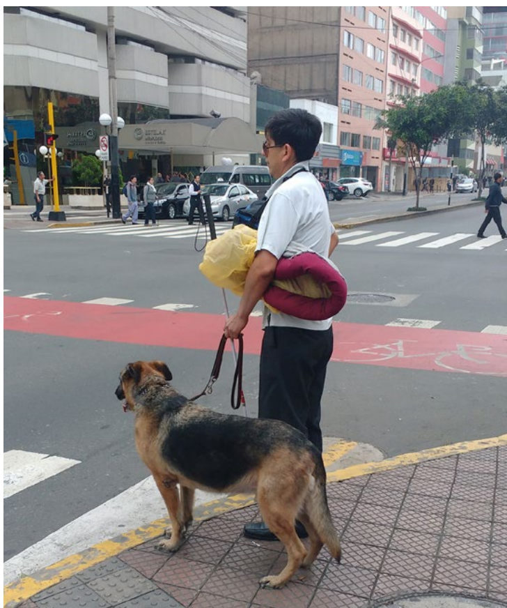
Buena práctica de tenencia de canes.

En cuanto a las regulaciones respecto a las obligaciones higiénicas sanitarias y ambientales mencionados en las Ordenanzas Municipales, el 86.2% (25) mencionan la obligación higiénico-sanitarias del ambiente de crianza del can, el 89.7% (26) indican la responsabilidad del recojo de las deposiciones de canes en áreas de uso público, y el